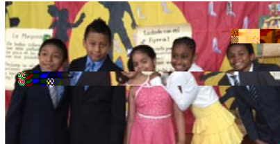
Estudiantes de Lenguaje Dual de la Escuela Primaria Cleveland