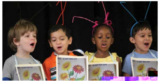
Estudiantes de Lenguaje Dual de la Escuela Primaria Bancroft

Un programa de Lenguaje Dual proporciona a los estudiantes al menos 50 por ciento de su enseñanza en otro idioma. En las EPDC, actualmente ofrecemos programas de Lenguaje Dual en Español en 11 escuelas. El currículo está diseñado para que la enseñanza en español desarrolle la enseñanza en inglés y viceversa. Los estudiantes que completen nuestros programas de Lenguaje Dual o Dos Idiomas serán bilingües y estarán alfabetizados en los dos idiomas, a la vez que también lograrán éxito académico y competencia cultural.